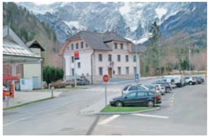
Središče Jezerskega je v celoti urejeno

"Dejstvo je, da je z obveznim financiranjem dejavnosti in s projekti, ki še potekajo, proračun že precej izčrpan in za nove projekte ne bo ostalo kaj dosti denarja. Sem se pa odločil, da vsa sredstva, ki gredo za društvene programe, vrnemo na izhodišče izpred štirih let, saj želim podpreti društveno življenje v kar največji meri. Sredstva za društva so bila v preteklosti okleščena zaradi projekta urejanja središča vasi. Dolgoročno je za našo skupnost pomemben projekt toplovoda oz daljinskega ogrevanja. Tu bo največji izziv najti zainteresirane, ki bodo v projektu prepoznali priložnost in izziv. Naložba je ekonomsko upravičena, če bodo na voljo dodatna sredstva iz državnih razpisov in bo zagotovljeno zadostno število odjemnikov toplotne energije. Sistem bo upravljala razvojna za-