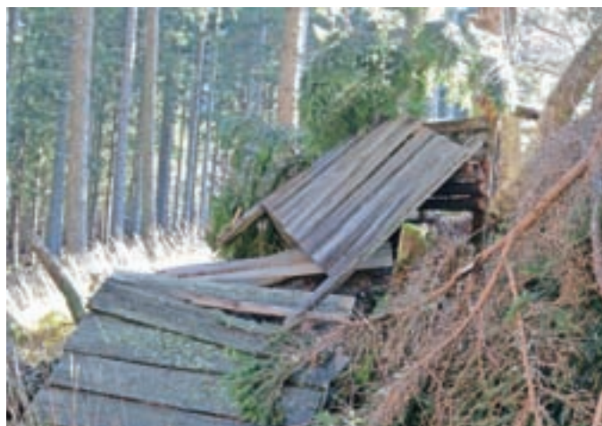
Podrta preža na Mlinarjevem sedlu letos novembra