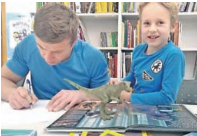
Delavnice z dinosavri

V Sloveniji imamo tudi Nacionalno strategijo za razvoj pismenosti, kjer je pismenost opredeljena kot trajno razvijajoča se zmožnost posameznika, da uporablja družbeno dogovorjene sisteme simbolov za sprejemanje, razumevanje, tvorjenje in uporabo besedil za življenje v družini, šoli, na delovnem mestu in v družbi.