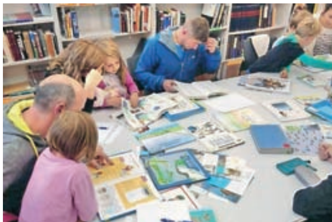
Delavnice Čudežna slatina

Prvi korak pri spodbujanju in razvoju je, da starše seznanimo s pomenom in načini razvijanja družinske pismenosti. Pri tem se poudarja vloga spodbudnega okolja ter pomen skupnega branja, pripovedovanja in pogovora o knjigi. In najpomembnejše: tudi s svojim lastnim zgledom in odnosom do branja in knjig.